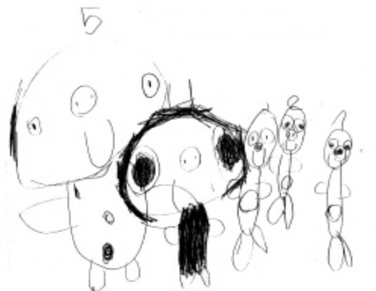
Paso 3: Todos los del equipo preparados para dibujar en la pancarta.

Preparamos las témperas y los pinceles y las dibujamos en la sábana. Unos escribían y otros ayudaban a tener la sábana extendida. Algunos niños de los otros equipos observaron el trabajo.