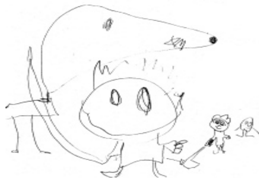
Paso 2: Extendemos entre todos la tela