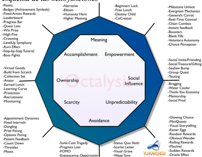
Imagen del esquema de las ocho funciones