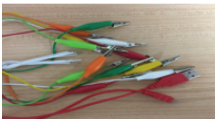
Figura 3. Cableado y pinzas de control.

Con respecto a su aplicación práctica, Dougherty (2012) afirma que el dispositivo Makey Makey presenta enormes potencialidades para ser utilizado en los centros educativos. Así, diversos trabajos fundamentados en experiencias innovadoras con esta herramienta robótica han constatado que contribuye a la concentración y a la motivación, además de potenciar el aprendizaje cooperativo, lo que propicia que mejoren las relaciones dentro del grupo de iguales y se contribuya a la consecución de aprendizajes significativos (Lozano, Guerrero & Gordillo, 2016) además de mejorar los resultados de las pruebas de evaluación, ya que los alumnos salen del aprendizaje convencional, se encuentran más motivados y trabajan con mayor nivel de autonomía (Chaves, Esquivel, Jiménez & Sánchez, 2018).