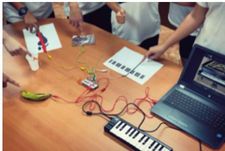
Figura 4. Materiales empleados en la UD.

Las actividades propuestas requirieron contar con materiales de conducción eléctrica (vaso con agua, utensilios de aluminio, fruta, material moldeable, lápices de colores, el cuerpo humano), un kit robótico Makey Makey, un ordenador, un altavoz, un sintetizador y una app para reproducir sonidos musicales (Pianissimo), como se presenta en la figura 4.