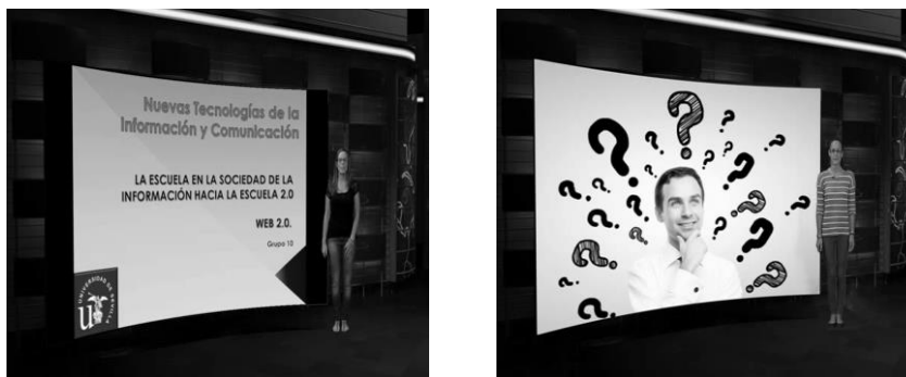
Figura 2. Polimedias realizados por los estudiantes.