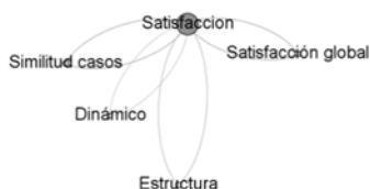
Figura 2. Relaciones entre las categorías del nodo satisfacción