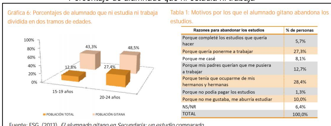
Figura 3. Motivos por los que el alumnado abandona los estudios. Porcentaje de alumnado que ni estudia ni trabaja