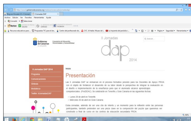
II Jornadas DAP

para la Continuidad Escolar) y permanece la figura