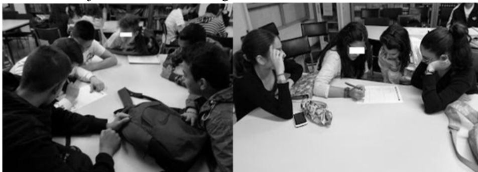
Figura 2. Grupos de discusión formados por estudiantes de 3º de ESO

Para la realización de la tarea se facilitó al alumnado una ficha (que debía ser cumplimentada de manera grupal) con información acerca de las causas por las que se empieza a tomar drogas, cómo evitar el consumo, y alternativas de ocio y tiempo libre alejadas de prácticas nocivas para la salud (tabla 4).