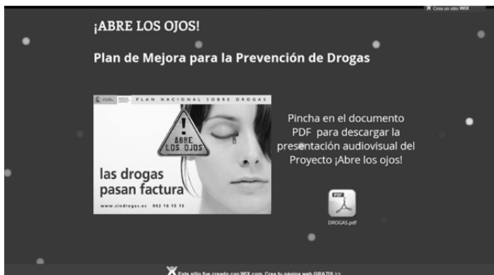
Figura 1. Captura de la página principal del Proyecto ¡Abre los ojos! en la red

En las dos primeras sesiones se abordaron contenidos teórico-informativos y se trabajó con el material audiovisual diseñado. La presentación utilizada por la pedagoga durante las exposiciones teóricas se encuentra disponible para su consulta y descarga en la dirección http://cmariaazorin.wix.com/abrelosojos (figura 1).