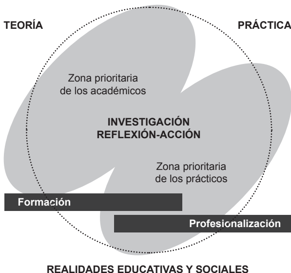
Figura núm. 2: Relaciones entre teoría y práctica en el ámbito socioeducativo Campo académico y profesional de la pedagogía social-educación social

La complejidad actual de nuestra mirada requiere de nuevos conceptos y términos ajustados a unas descripciones e interpretaciones del mundo mucho más precisas, profundas, conectadas