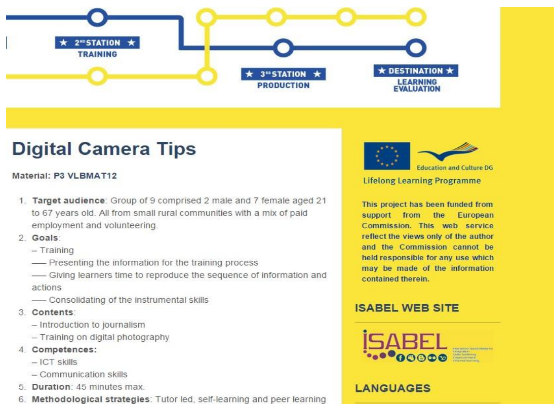
Figura 1: Ejemplo de ficha de un recurso sobre el uso de cámaras digitales, en la segunda estación. https://virtualllearningbuses.wordpress.com

Para facilitar su reutilización, bien de manera autodidacta (trayectoria de aprendizaje informal), o bien para orientar a nuevos formadores (educación formal o no formal), en cada recurso se describen: la audiencia original para la que se generó el recurso, las competencias clave a las que se dirige, los objetivos, los contenidos y algunas estrategias metodológicas (ver figura 1).