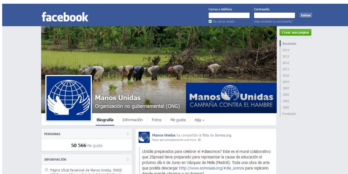
Ilustración 6: Manos Unidas en las redes sociales

Por último, señalar que de los 14 indicadores incluidos en la matriz de evaluación a modo de hipótesis, el análisis factorial ha demostrado que se pueden reducir a 12: (1) pertinencia, (2) eficacia-eficiencia, (3) aspectos metodológicos y contenidos, (4) participación, (5) nuevas tecnologías, (6) viabilidad-sostenibilidad, (7) cobertura, (8) coherencia, (9) visibilidad, (10) coordinación-trabajo en red, (11) apropiación y (12) calidad pedagógica.