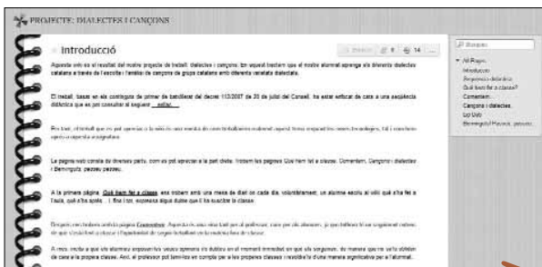
Imatge 5. Wiki sobre els dialectes del català

La revista digital El Suro és un projecte que preten acostar el periodisme a l'alumnat de secundària mitjançant el treball sobre els gèneres periodístics (imatge 6, a la pàgina següent). 11 A més, permet difondre notícies relacionades amb el centre i amb l'educació, recursos i projectes realitzats des de matèries i temes d'interès diferents per a l'alumnat. Els estudiants treballen de manera col·laborativa compartint experiències amb companys, professors i famílies. Els contin-