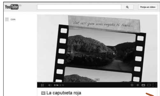
Imatge 4. Relat digital de La Caputxeta Vermella