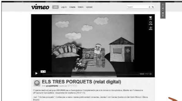
Imatge 3. Relat digital d' Els tres porquets