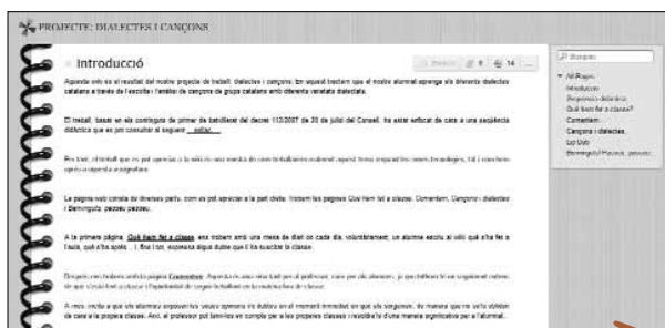
Imatge 5. Wiki sobre els dialectes del català

La revista digital El Suro és un projecte que preten acostar el periodisme a l'alumnat de secundària mitjançant el treball sobre els gèneres periodístics (imatge 6, a la pàgina següent). 11 A més, permet difondre notícies relacionades amb el centre i amb l'educació, recursos i projectes realitzats des de matèries i temes d'interès diferents per a l'alumnat. Els estudiants treballen de manera col·laborativa compartint experiències amb companys, professors i famílies. Els contin-