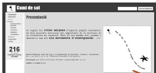
Imatge 7. Webquesta Cami de sol sobre les avantguardes literàries

La webquesta sobre els moviments d'avantguarda va permetre realitzar una sèrie d'activitats d'aprofundiment sobre les diferents avantguardes. El mètode de treball proposat per la webquesta està estructurat de manera clara, visualment atractiva i facilita la cooperació entre l'alumnat. La plataforma utilitzada, Google Sites, va permetre organitzar la webquesta en les activitats