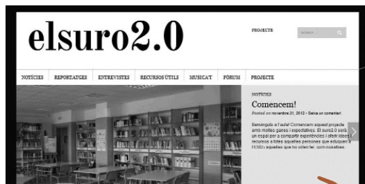
Imatge 6. Revista digital El Suro

guts inclosos van ser notícies sobre educació; reportatges relacionats amb la matèria; entrevistes; recursos diversos (lectures, TIC per presentar treballs, pràctiques de llengua i suggeriments d'activitats culturals), i Musica't , amb novetats i activitats relacionades amb la música en català i un fòrum de debat. També es va utilitzar la xarxa social Twitter per mantenir el contacte i difondre novetats.