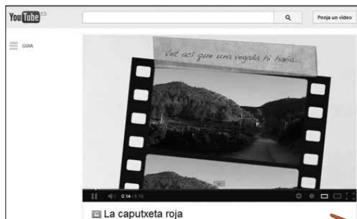
Imatge 4. Relat digital de La Caputxeta Vermella