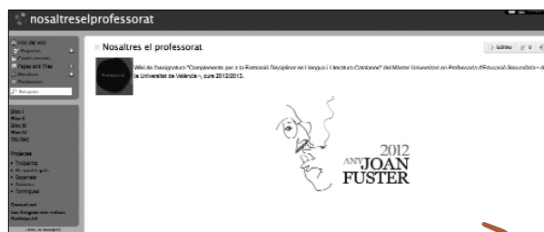
Imatge 2. Wiki Nosaltres el professorat

curs 2011-2012, es va utilitzar un blog d'aula, també anomenat Professorat del futur , per compartir notícies relacionades amb l'educació.