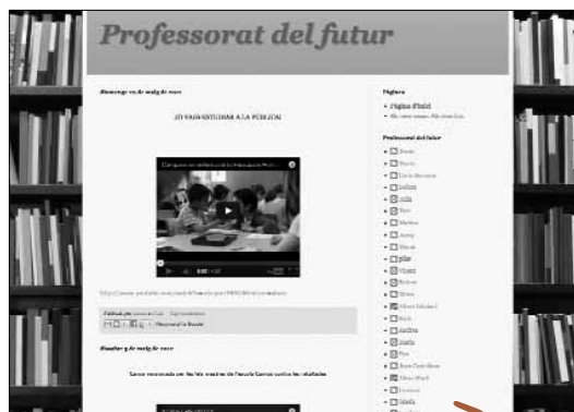
Imatge 1. Blog Professorat del futur