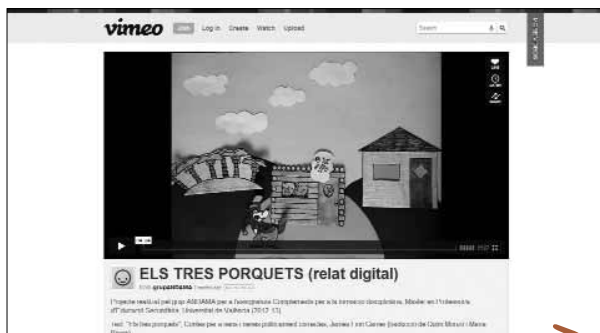
Imatge 3. Relat digital d' Els tres porquets