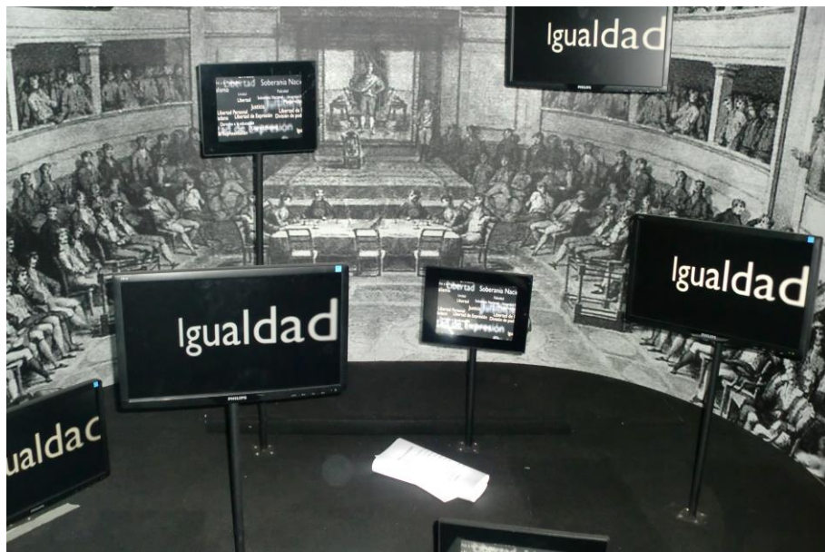
Fig. 4. Exposición para la conmemoración del II Centenario de la Constitución Española de 1812, destacándose los aspectos y avances más relevantes de este texto legal, que también podrían considerarse como referentes patrimoniales españoles y, por sus implicaciones, de la humanidad, asumiéndose como problemas relevantes de la actualidad (Exposición itinerante "Galeón La Pepa")

de educación patrimonial: epistemológica, didáctica, pedagógica y material. Por otro lado, investigaciones sobre el profesorado en formación inicial, tanto de educación primaria como secundaria, inciden en este tipo de problemas (CUENCA, 2002) que, por otro lado, pueden ser la base de las dificultades que los docentes en ejercicio encuentran para trabajar el patrimonio en sus aulas, según destacan otras investigaciones (ÁVILA, 2001; COHEN, 2003).