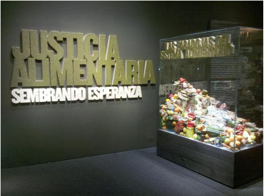
Fig. 3. Exposición en el que se emplean referentes patrimoniales como fuentes de información para explicar, desde posicionamientos sociocríticos, problemas sociales relevantes de la actualidad, como el desigual reparto de la riqueza, la pobreza y los consiguientes problemas de alimentación en el mundo (Exposición Justicia Alimentaria, Caixa Forum, Madrid)